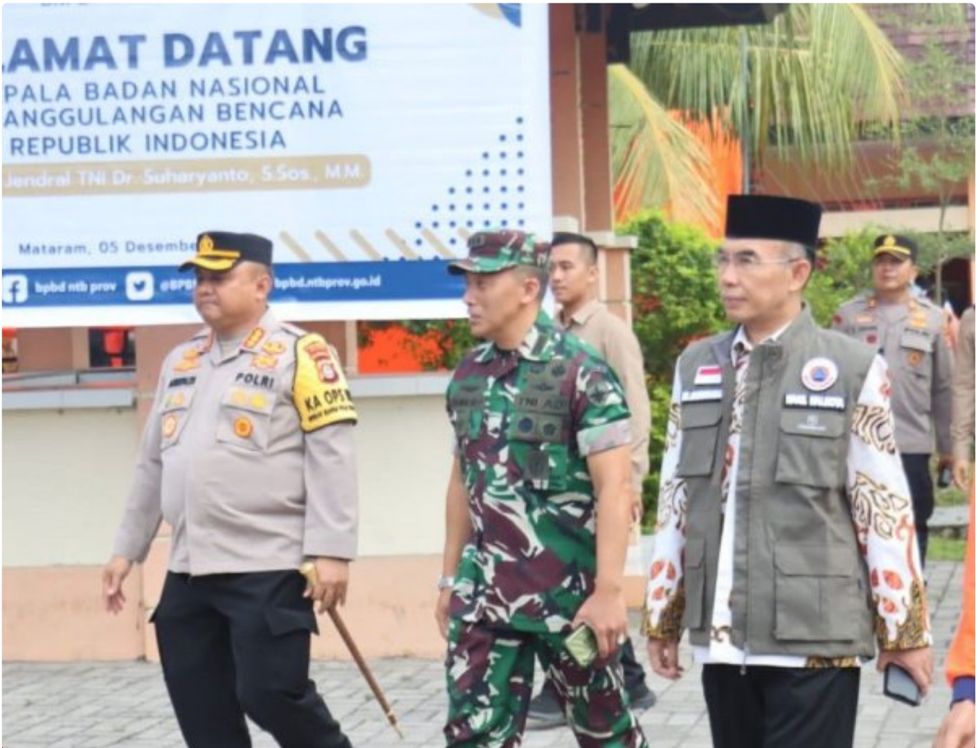
Kapolresta Mataram (Kiri) saat menghadiri acara Peletakan batu Pertama pembangunan gedung Pusdalops BPBD NTB, Kamis (05/12/2024)